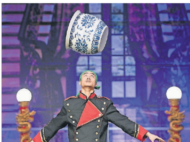
Weltklasse-Show aus dem Reich der Mitte: Szenen aus «Hongkong Hotel».