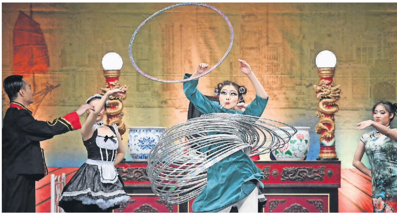
Die viel beschworene Einheit von Körper, Geist und Seele ist auch das Credo des Chinesischen Nationalcircus.

Hongkong war von Mitte des 19. bis zum Ende des letzten Jahrhunderts eine britische Kronkolonie im Südchinesischen Meer, umgeben von dem grossen, allgegenwärtigen Reich der Mitte. Nicht zuletzt ist es auch dieser besonderen Position zwischen den Welten geschuldet, dass in dieser Stadt Handel, Wirtschaft und Population boomten. Heute noch gehört diese Region zu den am dichtesten besiedelten Gegenden der Welt. Und damit ist das dortige Leben auf der Überholspur dafür prädestiniert, den globalen Spirit unserer Zeit, die Geschäftigkeit Chinas, das Wachstum von Handel und den Fortschritt des Lebens im gesamtasiatischen Raum zu sym-